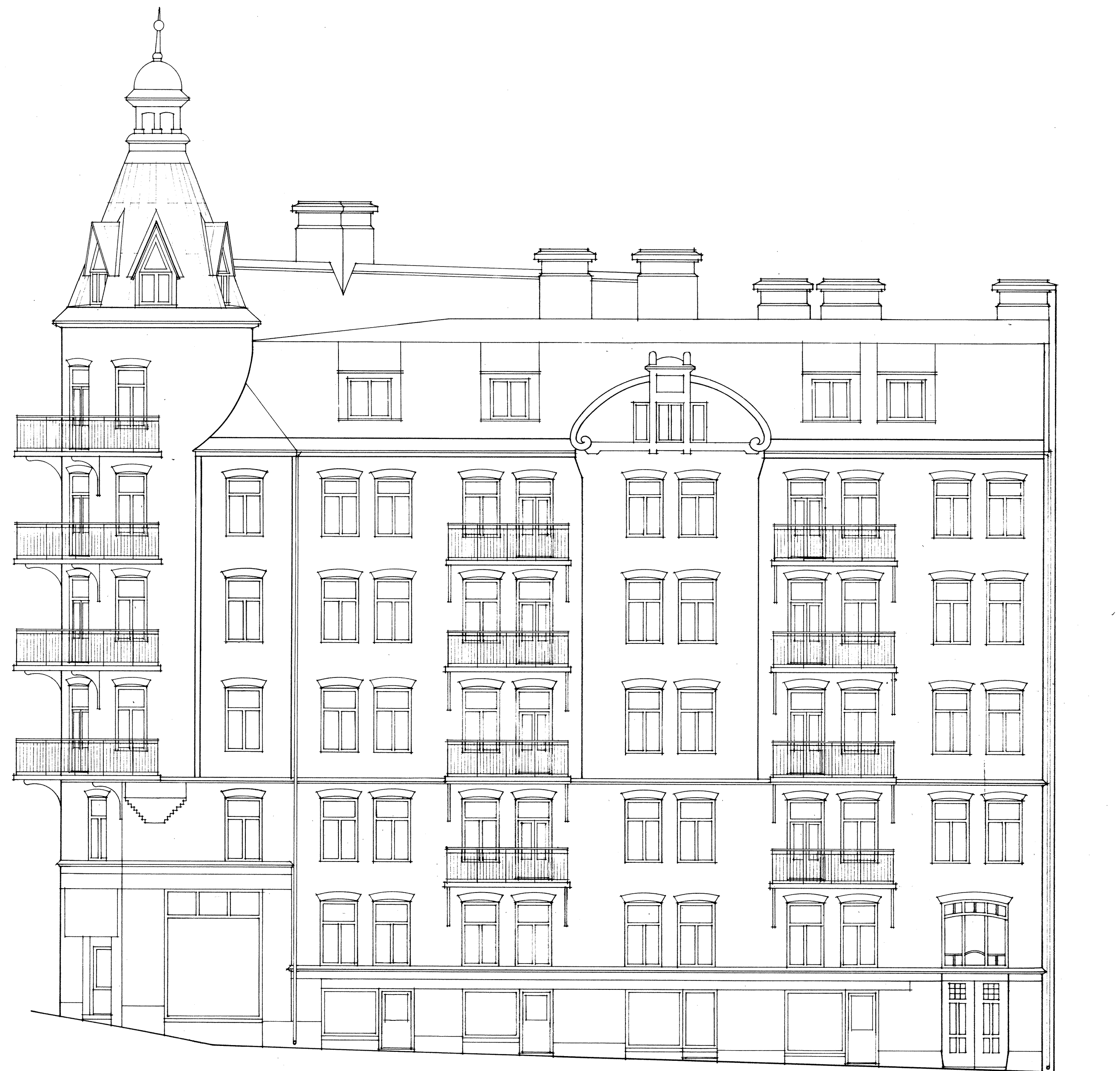
FASAD MOT NORDHEMSGATAN